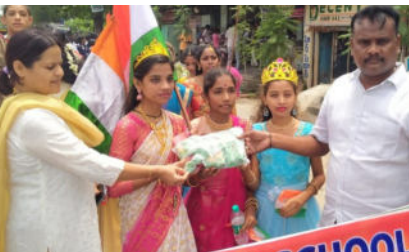
న్యాయశాఖ సిబ్బంది, పాఠా లీగల్ వాలంటీర్లు, న్యాయశాఖ విద్యార్థులు, లవ్లీ బజార్ ప్రభుత్వ బాలికల పాఠశాల విద్యార్థులు, ఎస్.ఎస్.ఎస్. వాలంటీర్లు తదితరులు పాల్గొన్నారు.