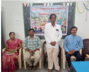
వారికి ఎమ్మెల్యే గులాబీ కందువా కప్పి పార్టీలోకి సాదరంగా ఆహ్వానించారు.