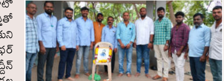
వారికి ఎమ్మెల్యే గులాబీ కందువా కప్పి పార్టీలోకి సాదరంగా ఆహ్వానించారు.