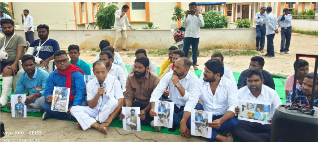
Vivo X60 - ZEISS Sep 7, 2023, 14:15