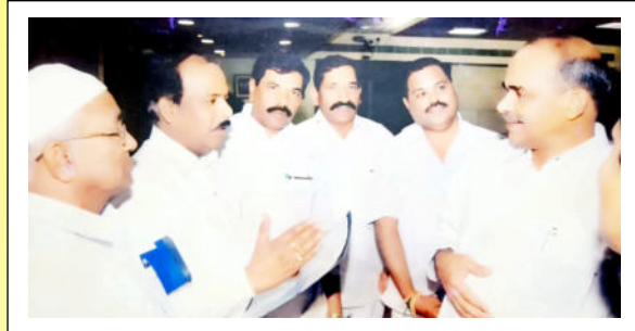
కొత్తవాడలోని శ్రీ ఆంజనేయ స్వామి ఆలయ అభివృద్ధికి కూడా తనవంతుగా సహాయ సహకారాలు అందిస్తున్నారు.