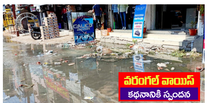
వరంగల్ వాయిస్ కథనానికి స్పందన

మురుగు తొలగించి మురుగు..మూడు రోజులు, పట్టించుకోని బల్లియా పేరిట బుధవారం వరంగల్ వాయిస్ దిన పత్రికలో ప్రచురితమైన వార్తకు గ్రేటర్ అధికారులు స్పందించారు. వరంగల్ చౌరాస్తా నుంచి స్టేషన్ రోడ్డు ప్రధాన రహదారిలో గత నాలుగు రోజులుగా మురుగు కాలువలు చెత్తతో నిండిపోయి ఉప్పొంగడంతో రహదారి బురదమయంగా మారిన విషయం తెలిసినది. అయితే శుక్రవారం ఉదయం బల్లియా సానిటేషన్ సిబ్బంది మురుగు కాలువను శుభ్రం చేయడంతో బాటసారుల కష్టాలు తీరాయి. - వరంగల్ వాయిస్, వరంగల్