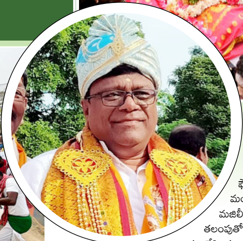
విధితమే. ఆయన మృతి వార్త

గుండె పోటుతో కన్ను మూసిన సామాజిక వేత్త మోక్షారామం ఫౌండేషన్ ద్వారా ఎన్నో సేవా కార్యక్రమాలు నివాళులర్పించిన ప్రముఖులు అంతిమ యాత్రలో పాల్గొన్న కుల బాంధవులు