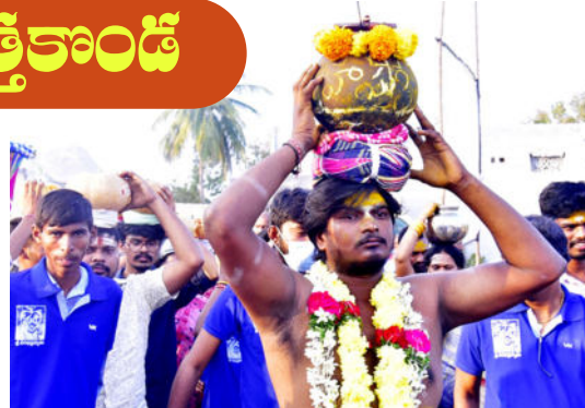
చుట్టూ తిరిగాయి. వీరభోసం వెంట వేలాది భక్తులు పాల్గొన్నారు.

వరంగల్ వాయిస్, భీమవరపల్లి : తెలంగాణలో ప్రసిద్ధి చెందిన కొత్తకాండ వీరభద్రస్వామి దేవాలయంలో జాతర బ్రహ్మోత్సవాలు అంగరంగ వైభవంగా సాగుతున్నాయి. హనుమకొండ జిల్లా భీమవరపల్లి మండలం కొత్తకాండలో వెలసిన వీరభద్రస్వామి ఆలయంలో మకర సంక్రాంతి పండుగను పురస్కరించుకొని విశేషమైన ఉత్తరాయణ పుణ్యకాలంలో ఉదయం స్వామివారికి మహాస్నానం పూర్వక ఏకాదశ రుద్రాభిషేకం, పంచామృత నవరసాభిషేకం, బిల్వార్చన రుద్ర పారాయణ పూజలు నిర్వహించారు. ఉత్సవాల్లో భాగంగా భోగిని పురస్కరించుకొని భక్తులు పెద్ద ఎత్తున తరలిరావడంతో క్యూలైన్లు కిక్కిరిసిపోయాయి. కోర వీరీసాలు సమర్పిస్తే కోరిన వరాలు అందిస్తాడని భక్తులు విశ్వాసం. ఉదయం నుంచే భక్తుల తాకిడి అధికమైంది. వరంగల్, కరీంనగర్, సిద్దిపేట, ఆదిలాబాద్, ఖమ్మం ఉమ్మడి జిల్లాల నుంచి భక్తులు అధిక సంఖ్యలో హాజరై స్వామికి మొక్కులు సమర్పించుకున్నారు. స్వామి దర్శనం కోసం భక్తులు రెండు గంటల పాటు వేచి చూశారు. భక్తులకు ఆలయ పాలక మండలి అన్ని వసతులు సమకూర్చింది. కోరిన కోర్కెలు తీర్చి వీరస్వకు భక్తులు కోరవీరీసాలు సమర్పించుకోగా, స్వామికి అత్యంత ప్రీతిపాత్రమైన గుమ్మడికాయలతో మహిళలు స్వామివారికి సమర్పించారు. ఆలయంలో ఏటా ఆనవాయితీగా వరంగల్ అర్బన్ జిల్లాకు చెందిన దామెరపుల వంశీయులు వీరభోసం సమర్పించారు. ఉల్లిగడ్డదామెర, కడిపికొండ నుంచి హాజరైన వీరు స్వామి వారికి న్యైవేద్యం సమర్పించే ఆనవాయితీగా వస్తుంది. శివసత్తుల పూసకంఠోపాటు వీరశ్రేణులు వీరభద్రం చేతబూని నృత్యం చేస్తూ డప్పుచప్పుళ్ల మధ్య వీర భోగాన్ని ఆలయం చుట్టూ ప్రదర్శించి వీరభద్రునికి సమర్పించారు. ఈ తంతు సుమారు రెండు గంటలపాటు సాగింది. ర్యాలీలో భాగంగా ఎడ్లబండ్లు ఆలయం