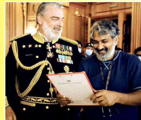
దర్శకధీరుడు ఎస్. ఎస్. రాజమౌళి తెరకెక్కించిన 'ఆర్ఆర్ఆర్' చిత్రంపై ఇంకా ప్రశంసల వర్షం కురుస్తూనే ఉంది. మరీ ముఖ్యంగా ఆస్కార్ అవార్డ్

వేదికపై పలువురు హాళివుడ్ దిగ్గజాలు ఈ సినిమాపై ప్రశంసల వర్షం కురిపించిన విషయం తెలిసిందే. వారిలో దిగ్గజ దర్శకుడు జేమ్స్ కామెరూన్ ఆర్ఆర్ఆర్ సినిమాను చూసి ఆశ్చర్యపోయినట్లుగా చెప్పుకొచ్చారు. అంతేకాదు, రాజమౌళిని షేక్స్పియర్తో పోల్చారు. రాజమౌళి కూడా జేమ్స్ కామెరూన్ కలవడంపై స్పందించారు. 'కలో.. నిజమో అని ఇప్పటికీ నమ్మలేక పోతున్నా.. నేను డైరెక్ట్ చేసిన సినిమాను అంతటి దిగ్గజ దర్శకుడు విశ్లేషించడాన్ని ఎప్పటికీ మర్చిపోలేను' అని రాజమౌళి సంతోషాన్ని వ్యక్తం చేశారు. ఇప్పుడు మరోసారి రాజమౌళిపై జేమ్స్ కామెరూన్ ప్రశంసలు కురిపించడంతో.. ఆర్ఆర్ఆర్ ట్యాగ్ ట్రెండ్ అవుతోంది. ఆ వివరాలలోకి వెళితే.. తాజాగా 51వ వార్షిక సాల్మన్ అవార్డుల వేడుకను అమెరికాలో గ్రాండ్ గా నిర్వహించారు. ఈ వేడుకలో జేమ్స్ కామెరూన్.. రాజమౌళి ప్రస్తావన తెచ్చారు. 'ఆర్ఆర్ఆర్'తో