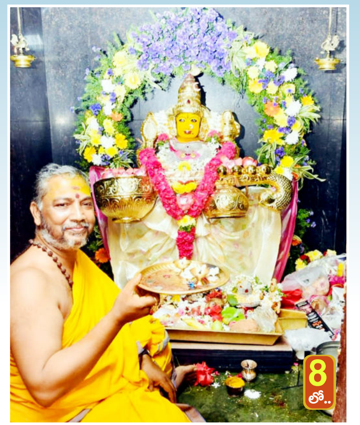
ఘనంగా వసంత పంచమి వేడుకలు