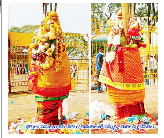
భక్తులు సమర్పించిన చీరలు, కానుకలతో సమృద్ధి సారలమ్మ దేవతలు

దేశ రాజధాని ఢిల్లీలో జరగుతున్న భారతీయ జనతా పార్టీ నేషనల్ కన్వెన్షన్ సమావేశంలో పాల్గొనేందుకు వరంగల్ జిల్లా బీజేపీ అధ్యక్షుడు గంట