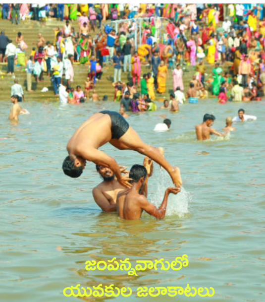
జంపన్నవారులో యువకుల జలాకాటలు