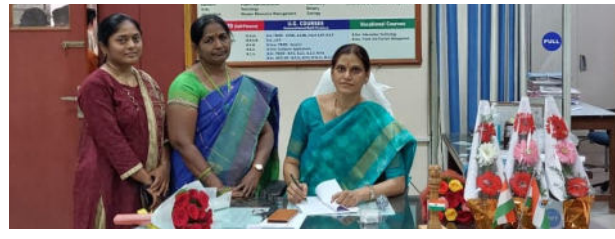
తదితరులు అభినందనలు తెలియజేశారు.