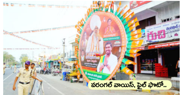
వరంగల్ వాయిస్, ఫైల్ ఫోటో..