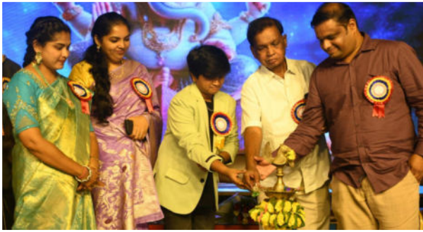
అలరించాయి. ఈ కార్యక్రమంలో విద్యార్థిని, విద్యార్థులు, తల్లిదండ్రులు వివిధ పాఠశాల కరస్పాండెంట్స్, ఉపాధ్యాయుని, ఉపాధ్యాయులు పాల్గొన్నారు.