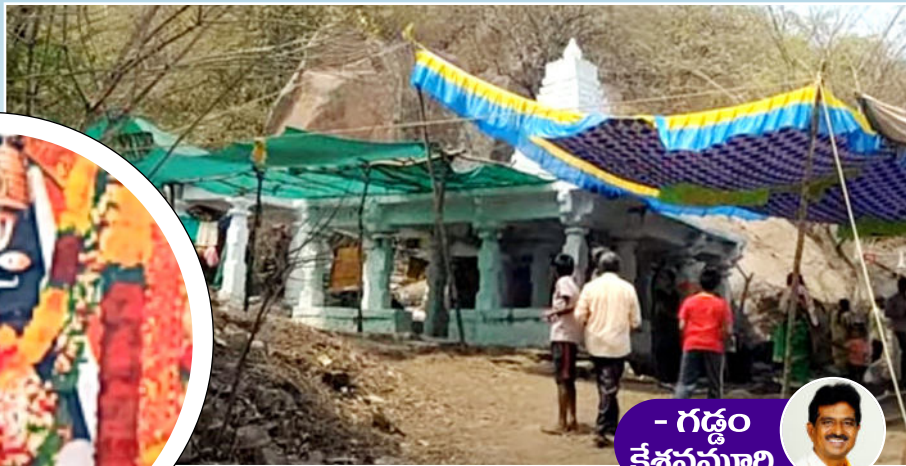
- గడ్డం కేశవమూర్తి