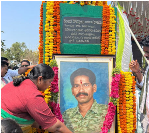
నాయకులు, ప్రజా సంఘాల నాయకులు, కవులు, కళాకారులు, ప్రజలు, పెద్ద ఎత్తున పాల్గొన్నారు.