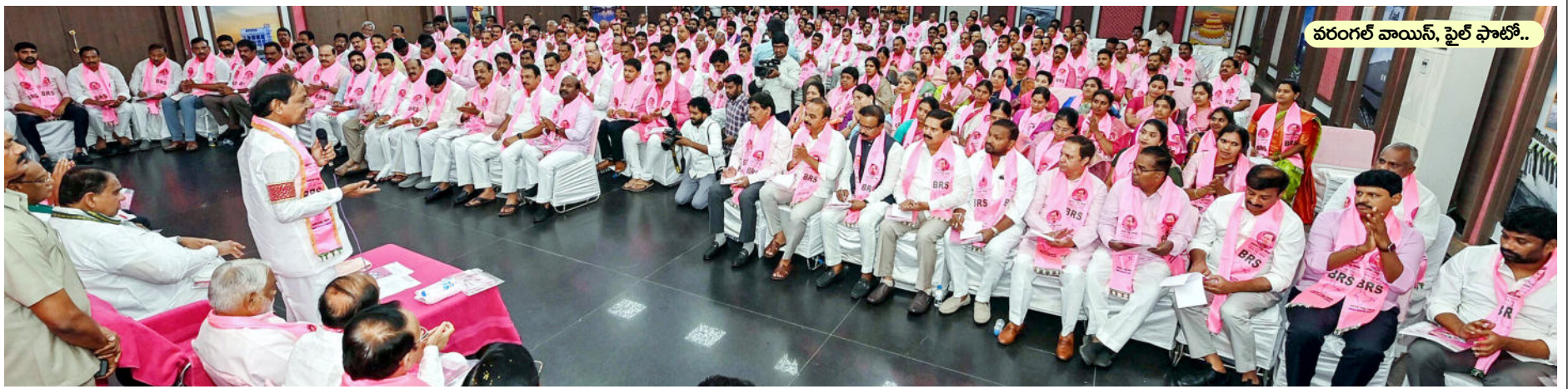
వరంగల్ వాయిస్, ఫైల్ ఫోటో..