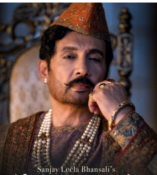
Sanjay Leela Bhansali's