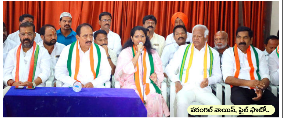
వరంగల్ వాయిస్, ఫైల్ ఫోటో..

వరంగల్ లోక్ సభపై ప్రత్యేక ఫోకస్ పాగా వేసేందుకు పక్కా స్కేచ్ రంగంలోకి సీఎం రేవంత్ రెడ్డి కడియం కుటుంబానికి అండగా నిలుస్తున్న క్యాడర్ వరుస సమావేశాలతో బజ్ బజ్ ప్రచారంలో దూకుడు పెంచిన నేతలు