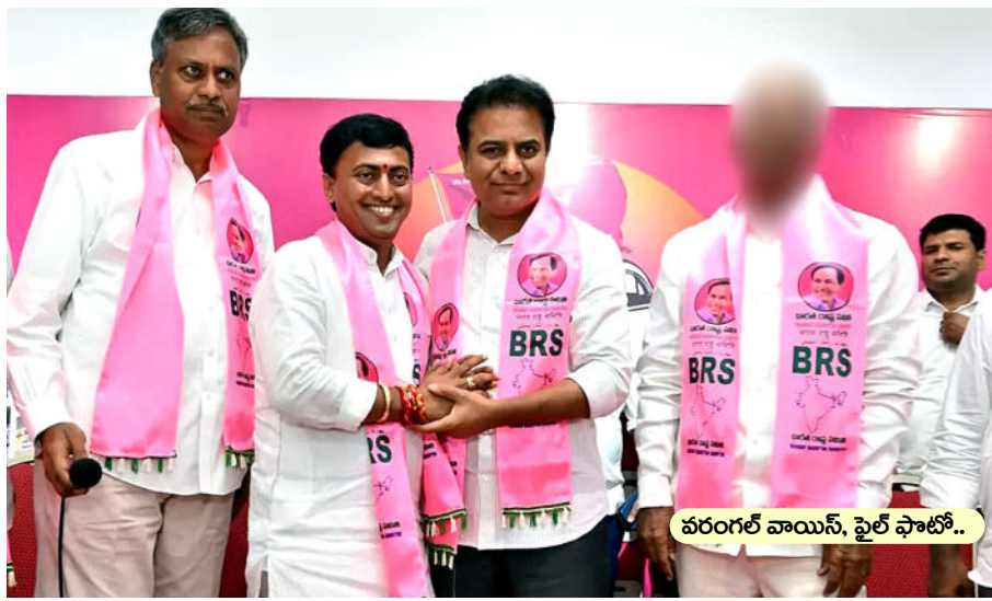
వరంగల్ వాయిస్, పైల్ ఫోటో..