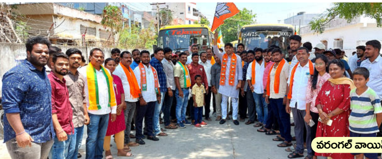
వరంగల్ వాయిస్, ఫైల్ ఫోటో..

నిజానికి కేంద్రంలోని బీజేపీ సర్కార్ దేశాన్ని అప్పులకుప్పగా మార్చేసిందని ప్రచారం చేయడంలో కాంగ్రెస్, బీఆర్ ఎస్ లు వెనుకబడిపోయాయి. బీజేపీ ప్రభుత్వం గడిచిన 9 ఏండ్లలో ఏటా సగటున రూ. 10 లక్షల కోట్ల అప్పులు చేసింది. ఫలితంగా 68 ఏండ్ల స్వతంత్ర భారతదేశంలో తీసుకొన్న అప్పుల కన్నా కేవలం తొమ్మిదేండ్ల మోడీ పాలనలో తీసుకొన్న అప్పులే ఎక్కువయ్యాయి. ఎడాపెడా అప్పులు చేసిన ఘనత నరేంద్ర మోడీదేన్నన్న విమర్శలు వ్యక్తమవుతున్నాయి. మరోవైపు పెట్రోల్, డీజిల్, వంటగ్యాస్ పై పన్నులు, సెస్సుల రూపంలో ప్రజల ముక్కు పిండి వసూలు చేస్తున్నారు. దేశవ్యాప్తంగా బుల్లెట్ ట్రైన్స్ ప్రాజెక్టు సహా 18 మెగా ప్రాజెక్టుల నిర్మాణానికి రూ. 5 లక్షల కోట్ల అంచనా ఖర్చుతో పునాదిరాళ్లు తమ పేర్లతో వేసుకొన్నారు. వాటికి పెట్టుకొన్న గడువు కూడా తీరిపోయింది. ఒక్క తట్టెడు మట్టితీసిన పని కూడా జరగ లేదన్న విమర్శలను ప్రతి పక్షాలు ప్రజల్లోకి తీసుకెళ్లడంలో విఫలమయ్యాయి. రూ. 80 లక్షల కోట్ల అప్పు సంగతి దేవుడెరుగు.. ఏటా రూ. 3 లక్షల కోట్లు పెట్రో బాదుడుతోనే వసూలు చేస్తున్నారు. ప్రజల్లో వ్యతిరేకత పెరుగుతున్నా.. పట్టించుకోవడం సూత్రాన్ని అవలంబిస్తున్నారు. ఎదురుదాడి చేస్తున్నారు. రాష్ట్రాల్లో అభివృద్ధి అంతా తమ చలువేనని బాటుకుంటున్నారు. సిగ్గావగ్గా లేకుండా ప్రజలను జలగల్లా పీల్చి పిప్పి చేస్తున్నారు. దీనికి చరమగీతం పాడకుంటే నష్టపోయేది ప్రజలే. ప్రజలు దీనిని నిరసించాలి. ఎక్కడికక్కడ నిలదీయాలి. సోషల్ విరిడియా విష ప్రచారాలను పసిగట్టాలి. ఎదురుదాడి ప్రారంభించాలి. వాటిని తిప్పికొట్టాలి. అప్పుడే ప్రజలు విజయం సాధిస్తారు.