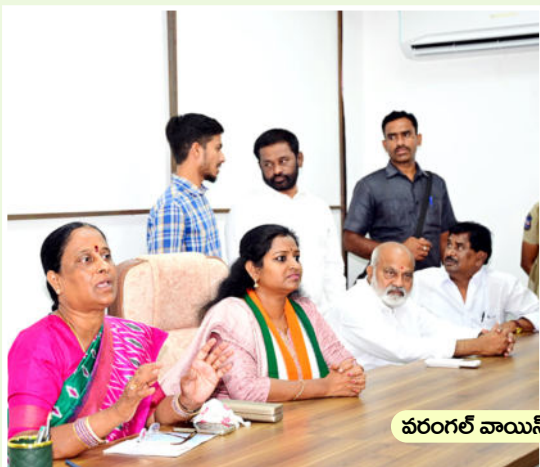
వరంగల్ వాయిస్, ఫైల్ ఫోటో..