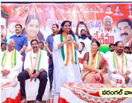
వరంగల్ వాయిస్, ఫైల్ ఫోటో..