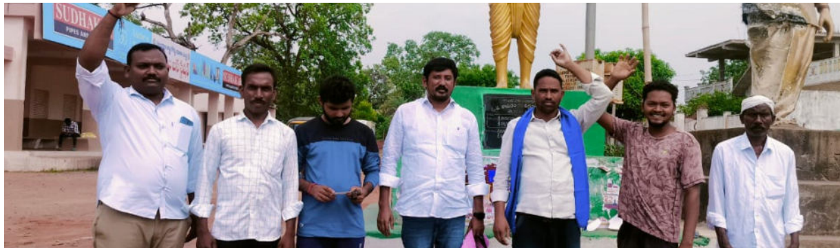
రేపటి డీబీఎఫ్ రాష్ట్ర మహాసభలను విజయవంతం చేయండి