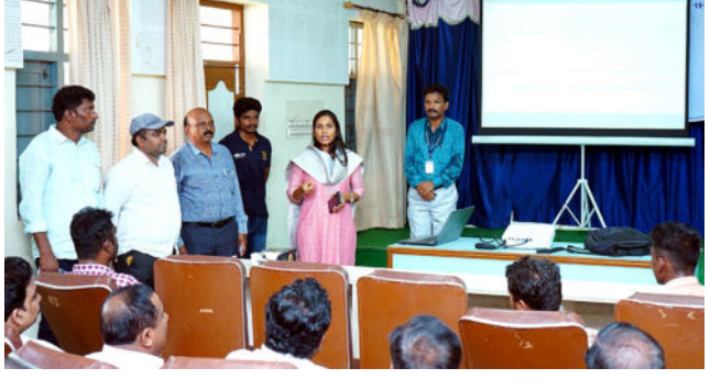
బి, అగ్నిమాపక, వైద్య ఆరోగ్య, ఎస్ పీడీసీఎల్, తదితర శాఖల అధికారులు పాల్గొన్నారు.