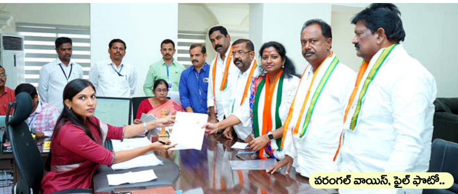
వరంగల్ వాయిస్, ఫైల్ ఫోటో..