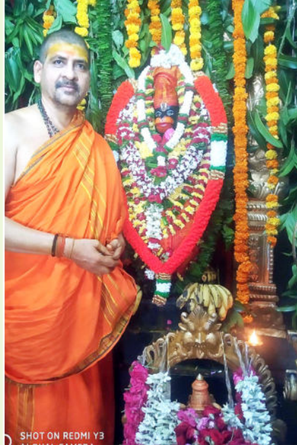
SHOT ON REDMI Y3