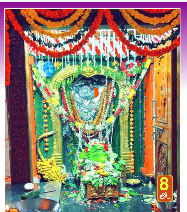
8లో.. ఘనంగా హనుమాన్ జయంతి వేడుకలు కొండగట్టుకు తరలిన భక్తులు ప్రసన్నాంజనేయ స్వామి దేవాలయంలో ప్రత్యేక పూజలు

భారీగా పట్టుబడుతున్న నాసీరకం పత్తి విత్తనాలు అయినా ఆగని దండా అమాయక రైతులే టార్గెట్ గా విక్రయాలు గ్రామాల్లో యధేచ్ఛగా అమ్మకాలు నట్టేట ముసుగుతున్న అన్నదాతలు