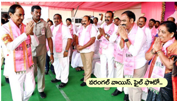
వరంగల్ వాయిస్, ఫైల్ ఫోటో..

కమలం వైపు 'కారు' చూపులు పార్టీ మారేందుకు సిద్ధమౌతున్న బీఆర్ఎస్ లీడర్లు మండల, నియోజకవర్గ పదవులపై ఆశలు