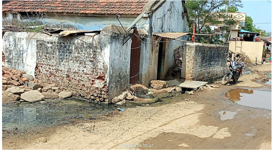
విగిలిపోగా మార్పిలో వాటిని రాష్ట్ర ప్రభుత్వం వెనక్కి తీసుకున్నట్లు సమాచారం.

గ్రామ పంచాయతీకి మూడు రకాల ఖాతాలు ఉంటాయి. ఒకటి ఆస్తిపన్ను జమ చేసుకునే ఖాతా... గ్రామాల్లో ఆస్తిపన్ను వసూలు అంతంతమాత్రంగా జరగడం, ఖర్చులు నాలుగు రెట్లు అదనంగా ఉండటంతో ఇది ఎప్పుడు ఖాళీగానే ఉంటుంది. రెండో ఖాతా ఎస్ఎఫ్సీ. ఇందులో రాష్ట్ర ప్రభుత్వం నుంచి ప్రత్యేక నిధులు జమ చేస్తారు. ఈ రెండు ఖాతాల్లో జమయ్యే మొత్తం ట్రెజరీ ద్వారా డ్రా చేయాల్సి ఉంటుంది. కానీ గత సర్కారు హయాంలో ఎస్ఎఫ్సీ నిధులు అరకొర మంజూరుతోనే సరిపెట్టింది. మూడో ఖాతా 15వ ఆర్టికల్ సంఘం నిధులు ఇందులో జమ అవుతాయి. కేంద్ర సర్కారు నేరుగా పంచాయతీలకు గ్రామ జనాభా ప్రాతిపదికన జమ చేస్తుంది. ప్రతీ నాలుగు నెలలకు ఒకసారి వీటిని అందజేస్తుంది. కేవలం ఈ నిధులు మాత్రమే పంచాయతీలకు అందుతుండడం. వీటిని ప్రత్యేక పనులకు ఖర్చు చేయాల్సి ఉంటుంది. నిబంధనల మేరకు ఖర్చు చేయని నిధులు ఆయా ఖాతాల్లో