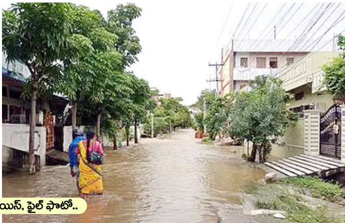
వరంగల్ వాయిస్, ఫైల్ ఫోటో..