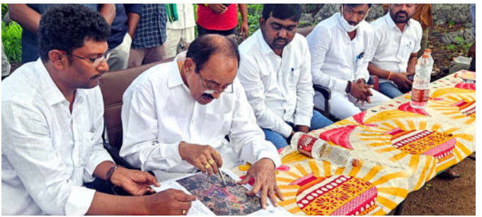
చెల్లెస్తామన్నారు. భూములు కోల్పోతున్న అన్నదాతలు వరంగల్ పట్టణానికి చేరువలోనే ఉన్న గుంటూరు పల్లికి అతి సమీపంలోనే రహదారి పోయే విధంగా చూడాలని ఎమ్మెల్యే దృష్టికి తీసుకెళ్లారు. ఈ కార్యక్రమంలో అధికారులు కాంగ్రెస్ నాయకులు పాల్గొన్నారు.

వరంగల్ వాయిస్, పరకాల : పరకాల నియోజకవర్గం పరిధిలోని ఖిలా వరంగల్ మండలం గుంటూరుపల్లి, గాడిపల్లి పరిధిలో మామునూర్ ఎయిర్ పోర్ట్ నిర్మాణంలో భూములు కోల్పోయిన రైతులను ఆదుకుంటామని పరకాల ఎమ్మెల్యే రేవూరి ప్రకాశ్ రెడ్డి హామీ ఇచ్చారు. తొలిదశలో విమానాల రాకపోకలకు వీలుగా భూమిని సేకరించాలని ఇటీవల రాష్ట్ర ప్రభుత్వం నిర్ణయించడంతో అధికారులు, ఆయా గ్రామాల రైతులతో మంగళవారం ఎమ్మెల్యే సమీక్ష సమావేశాన్ని నిర్వహించారు. భూములు కోల్పోతున్న రైతులకు పరిహారం చెల్లించే విషయంలో ప్రభుత్వం చిత్తుపడితే ఉండవచ్చు. విషయాన్ని ముఖ్యమంత్రి దృష్టికి తీసుకువెళ్లి రైతులకు న్యాయం జరిగేలా చూస్తానన్నారు. గాడిపల్లిలో సుమారు 12 మంది ఇండ్లు కోల్పోతుండడంతో, వారి ఇండ్లను సందర్శించి ఇంటి యజమానులకు తగు నష్టపరిహారం