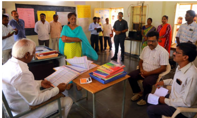
డీఎంహెచ్ఓను ఆదేశించారు. ఈ కార్యక్రమంలో ఎమ్మార్వో, ఎంపీడీఓ, అధికారులు, స్థానిక ప్రజా ప్రతినిధులు, నాయకులు, కార్యకర్తలు తదితరులు పాల్గొన్నారు.