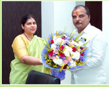
కలెక్టర్ను కలిసిన కుడా చైర్మన్