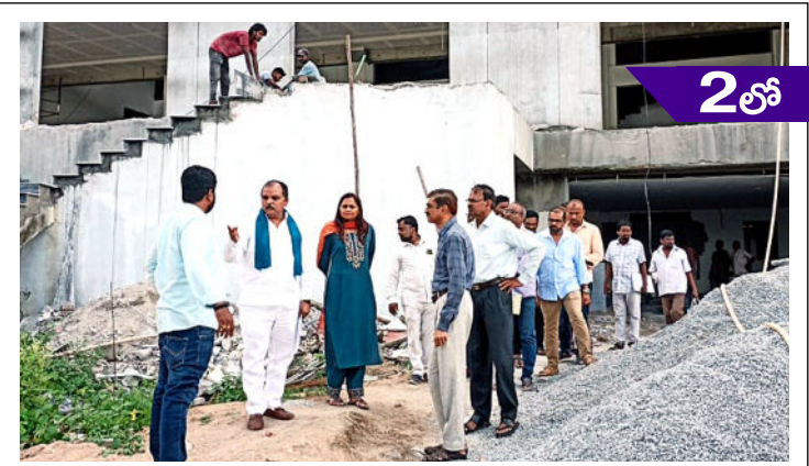
సెప్టెంబర్ 9న కాళోజ్ కళా క్షేత్రం ప్రారంభం ఈలోపు పనులు పూర్తి చేయాలి అధికారులకు కుడా చైర్మన్ ఇనగాల ఆదేశం