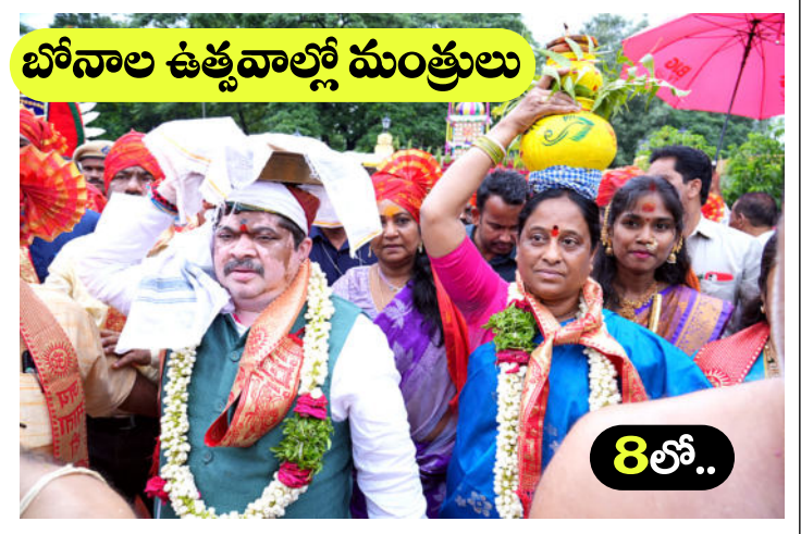
బోనాల ఉత్సవాల్లో మంత్రులు