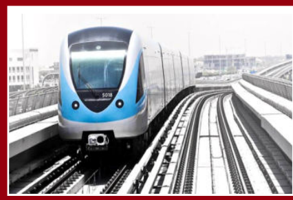
వరంగల్ వాయిస్, వరంగల్: విదేశాల్లో ఇప్పటికే విజయవంతంగా నడుస్తున్న మెట్రో నియో ప్రాజెక్టును వరంగల్ లాంటి టైర్-2 నగరాల్లోను ప్రజలకు అందుబాటులోకి తీసుకురావాలని గత పాలకులు

భావించారు. ప్రస్తుతం వరంగల్ మహానగర జనాభా పద కొండు లక్షలు కాగా మరో 20 ఏళ్లకు అంటే 2044కి నగర జనాభా 20నుంచి 30 లక్షల మధ్య తరహా నగరమైన నాసిక్కు ప్రతిపాదించిన నియో మెట్రో విధానం వరంగల్ కు చక్కగా సరిపోతుందని భావించిన పాలకులు దీన్నే ప్రతిపాదించారు. ఈ మేరకు నిర్మాణ పనులను మహారాష్ట్ర మెట్రో రైల్ కార్పొరేషన్ లిమిటెడ్ కు అప్పగించారు.