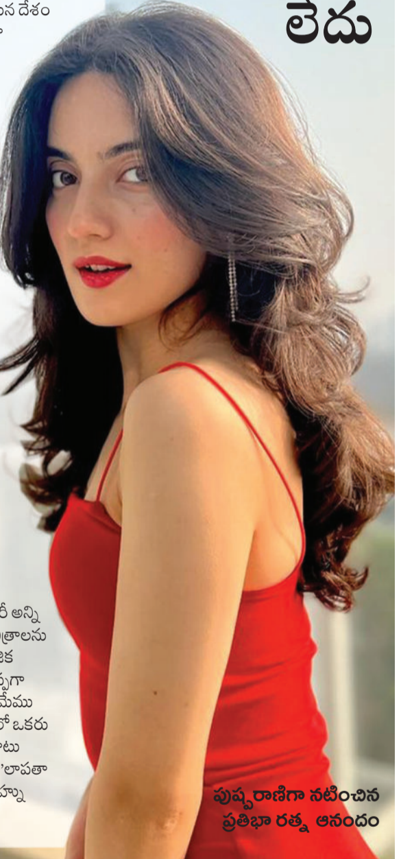
పుష్ప రాణిగా నటించిన ప్రతిభా రత్న ఆనందం