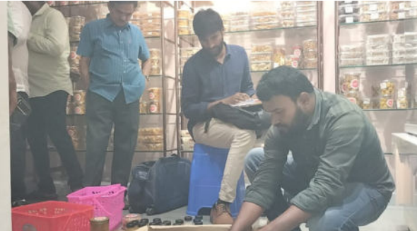
లైసెన్స్ రద్దు చేయాలని విద్యార్థుల సంఘం నాయకులు డిమాండ్ చేశారు.