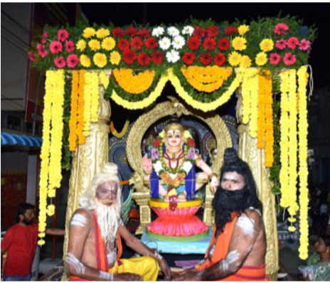
ఇందులో అయ్యప్పలతోపాటు స్థానికులు కూడా అధిక సంఖ్యలో పాల్గొని విజయవంతం చేయాలని సూచించారు.

మంత్రముగ్ధులను చేసింది. వారు చేసిన నృత్యాలు ఆకట్టుకున్నాయి. లక్కవారి వాడ, ఉర్బు చిన్న మహంకాళి ఆలయము, ఉర్బు ప్రసూతి ఆసుపత్రి వీధి, కుమ్మరి వాడ, ఉర్బు జెండా, పద్మశాలి వీధి, ఉర్బు బొడ్రాయి మీదుగా శ్రీ నాగేశ్వరస్వామి దేవాలయం వరకు జరిగి శ్రీ అయ్యప్ప స్వామి శోభాయాత్రలో స్థానికులు అధిక సంఖ్యలో పాల్గొన్నారు. మహిళలు మంగళహారతులతో శోభాయాత్రకు స్వాగతం పలికారు. ఈనెల 8వ తేదీ ఆదివారం నాగమయ్య గుడి వద్ద అయ్యప్ప స్వామి మాహా పడిపూజ, మహా అన్నదాన కార్యక్రమాన్ని నిర్వహించనున్నట్లు అయ్యప్పలు తెలిపారు.