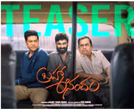
కామెడీ కింగ్ బ్రహ్మానందం, ఆయన తనయుడు రాజా గౌతమ్ ప్రధాన పాత్రల్లో నటిస్తున్న తాజా