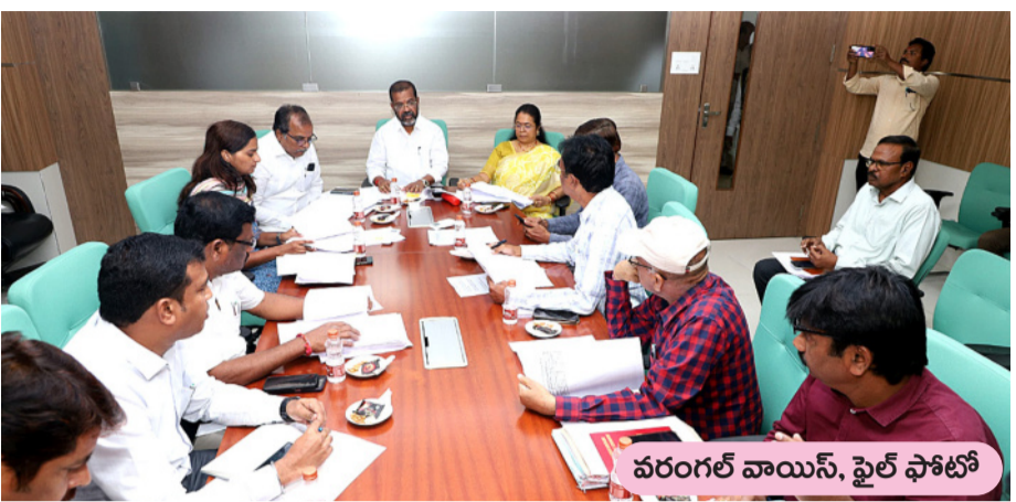
వరంగల్ వాయిస్, ఫైల్ ఫోటో

చర్యలుంటాయంటూ హెచ్చరిస్తున్నారు. లక్ష్యం రూ.118.08 కోట్లు.. గ్రేటర్ వరంగల్ పరిధిలో 2,17,620 నివేశన గృహాలున్నట్లు అధికారులు లెక్క గట్టారు. వీరి ద్వారా ఆస్తి, నీటి పన్ను వసూళ్ల లక్ష్యం రూ.118.08 కోట్లుగా నిర్ణయించారు. ఈ మొత్తాన్ని 31 మార్చి 2025లోగా వసూళ్లు చేయాల్సి ఉంది. దీనికి తోడు పాత బకాయిలు రూ.24.02 కోట్లు గత కొన్ని సంవత్సరాలూగా పెండింగ్ లోనే ఉన్నాయి. అయితే మార్చి 15 నాటికి నగరంలోని 1,03,384 గృహ యజమానుల నుంచి రూ.59.04 కోట్ల ఆస్తి, నీటి పన్ను వసూళ్లు మాత్రమే పూర్తి చేశారు. మరో రూ.59.04 కోట్ల పన్నులు పెండింగ్ లోనే ఉన్నాయి. వీటితో పాటు పాత బకాయిలు రూ.5.33 కోట్లు మాత్రమే వసూలు చేశారు. ఇంకా పాత బకాయిలు రూ.18.69 కోట్లు పెండింగ్ లోనే ఉన్నాయి. గతదాది 60 శాతమే.. 2023-24 ఆర్థిక సంవత్సరానికి ఆస్తి, నీటి పన్ను వసూళ్ల లక్ష్యం రూ.97.66 కోట్లు కాగా అందులో రూ.63.96 కోట్లు మాత్రమే వసూలు చేయగలిగారు. అంటే 60 శాతం మాత్రమే పన్నులు వసూలయ్యాయి. ఈ ఆర్థిక సంవత్సరంలో మార్చి 15 నాటికి 50శాతం మాత్రమే పన్నులు వసూలయ్యాయి. మరో పది రోజులు గడువు ఉన్నందున అధికారులు ఎంత ఒత్తిడి చేసినా మరో పది శాతం మాత్రమే పన్నులు వసూలుచేసే అవకాశం ఉంది. అంటే ఈ ఏడు పన్ను